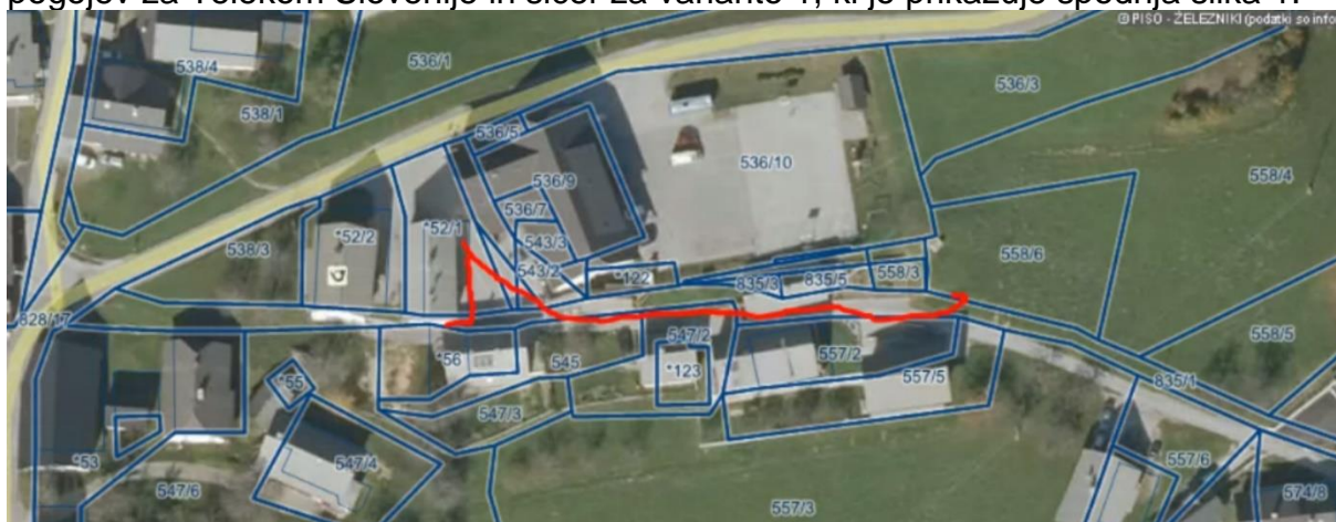
Slika 1: Varianta 1

Svet KS Sorica je na 14. seji Sveta KS Sorica že izdal mnenje na pridobitev projektnih pogojev za Telekom Slovenije in sicer za varianto 1, ki jo prikazuje spodnja slika 1.